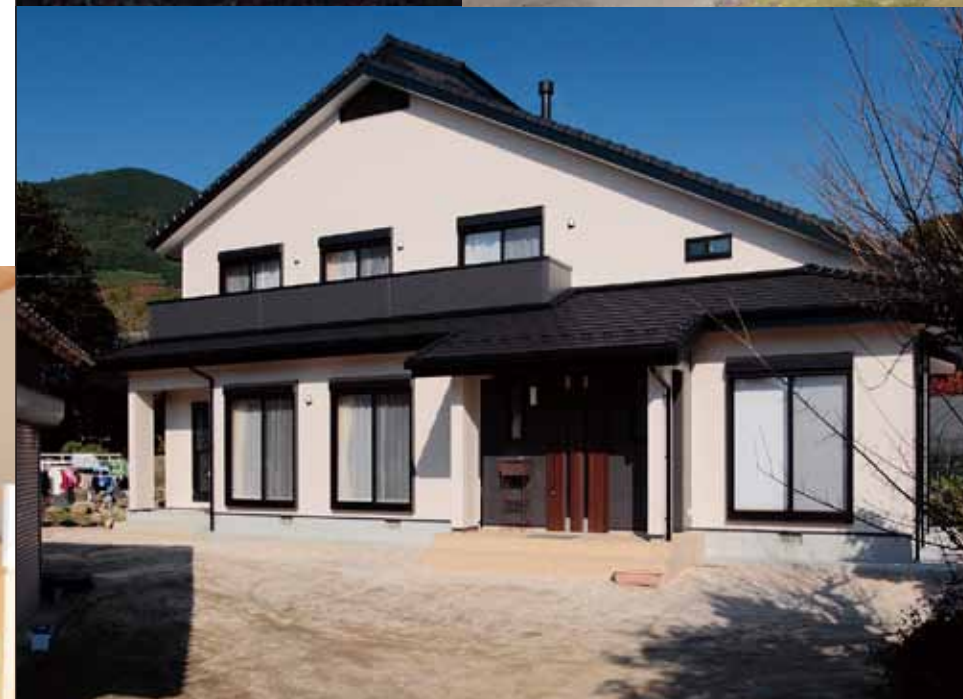
四季それぞれに豊かな表情を見せる木々に囲まれた地に、Kさん邸は佇む。陽の光を一杯取り入れるため、あえて土地なりではなく、リビングが真南に向くように設計されており、違和感なく周囲の自然環境に溶け込む。将来は、手前にある小屋を移動して、ウッドデッキをつくる予定。