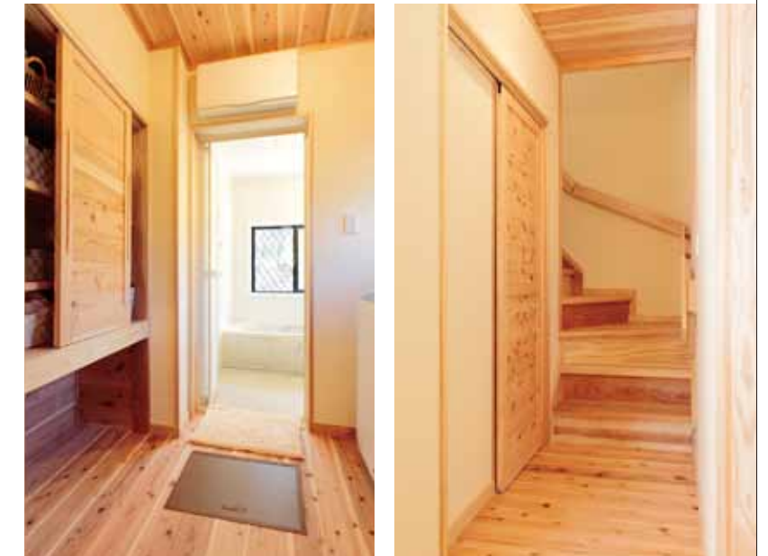
左上／水回りはキッチンと最短距離で結ばれ、申し分ない設計。隙間を作らず空間を一杯使った造作棚により、広々、スッキリとした空間となっている。