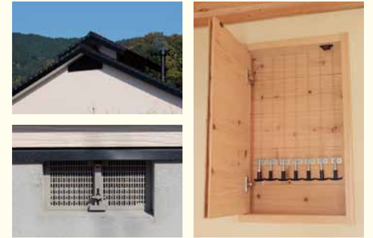
左上・左下／〈エアバス工法〉は、エアコンなどの機械設備を使わずに自然の力(太陽熱、地熱)を利用して、「夏涼しく」「冬暖かい」住まいを実現する。腰屋根と床下に取り付けられた換気口を通じて空気が循環する。