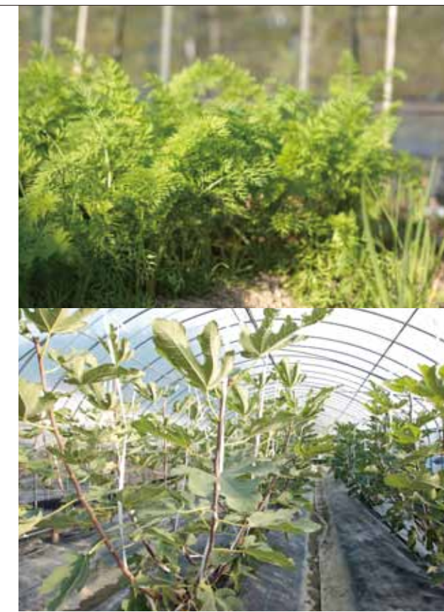
敷地内にあるビニールハウスで、「とよみつひめ」という福岡県オリジナルのいちじくを栽培するご主人。田んぼも所有しているため、季節によって米や野菜もつづっている。