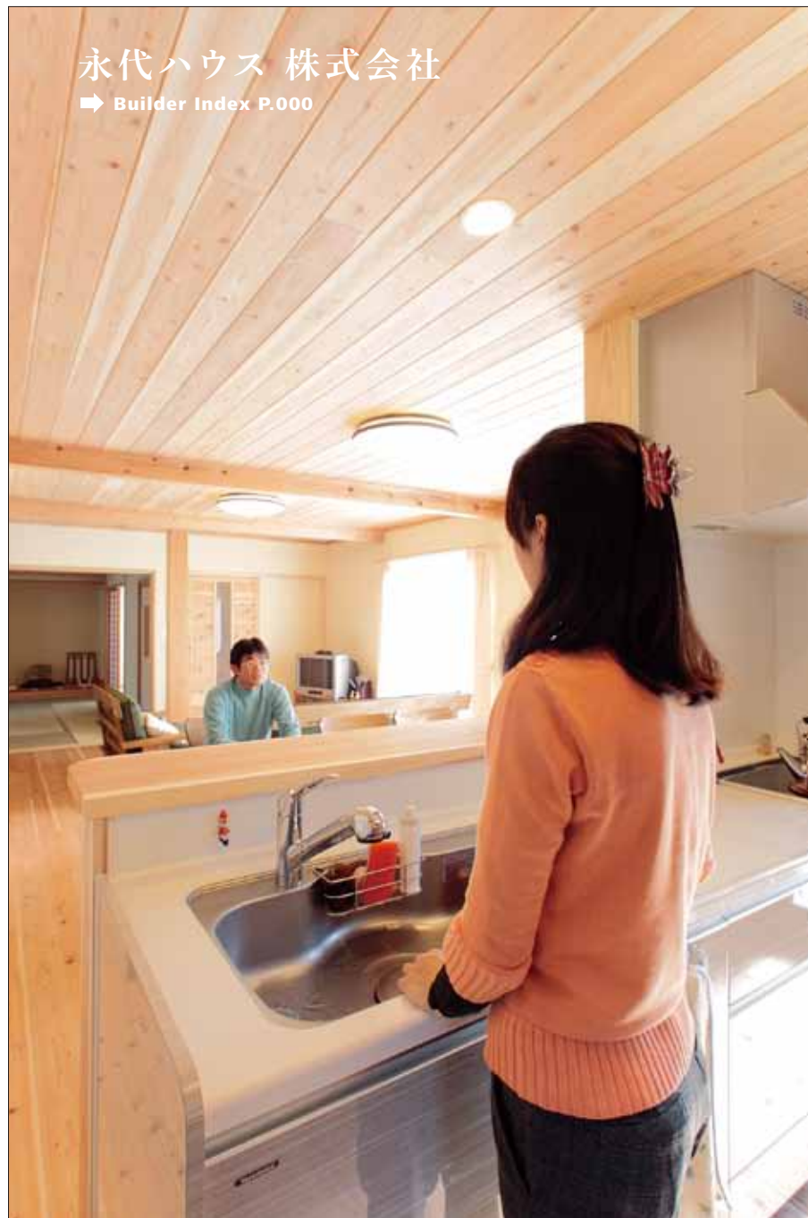
子どもの面倒をみながら家事ができるよう、リビングを見渡せるように配されたキッチン。家族と会話できるのもうれしい。