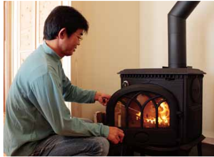
ご主人こだわりの薪ストーブ。「手に入れようと思えば、こちらへは薪の宝庫ですよ(笑) けっこうな柿の産地なので、枝をもらえばいいからね。柿の枝は煙が出ないし、弾かないし」

10月初旬から住み始めた新居の1階は、LDKが中心にあり、客間を兼ねた和室と合わせると、さらに広々とした開放感のあるつくり。先述したエアバス工法が取り入れられているのはもちろんのこと、リビングを南向きにしているため、大きな開口部から陽の光がたっぷり注がれ、とても暖かい。キッチン是对面式にし、子どもたちから目を離さずに家事ができるように。そしてなんとと言っても、注目すべきは、ご主人が何としても入れたかった薪ストーブ。建具にまで無垢材を使った暖かみのある空間としっくりなじむ仕上がりになっている。「からだの芯からあったまるという感覚がありますし、それが長く続くのがわかるんです」。でも、気になるのはその手間。奥さまの反応はどうだったのだろう。「最初は反対だったんです。どうせ、朝早く起きて、火を入れるのはわたしでしょ、って思ってた。むずかしそうだったし。でも、昨日こそ自分で火を入れてみたら、『あっ、意外に簡単につくんだ!』と思ってうれしかったんですけどね(笑)」。薪ストーブの使い方はいろいろ。暖まること、料理をすること、ただただ見つめること…。ゆらめく炎を囲みながら、きっと、家族のコミュニケーションを深めることに一役買ってくれることだろう。