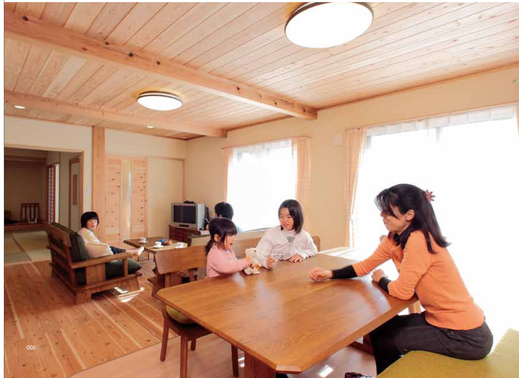
広々としたダイニング。床は杉材で、足触りがやわらかく、かつサラサラ。大きな窓の先に、庭がある。