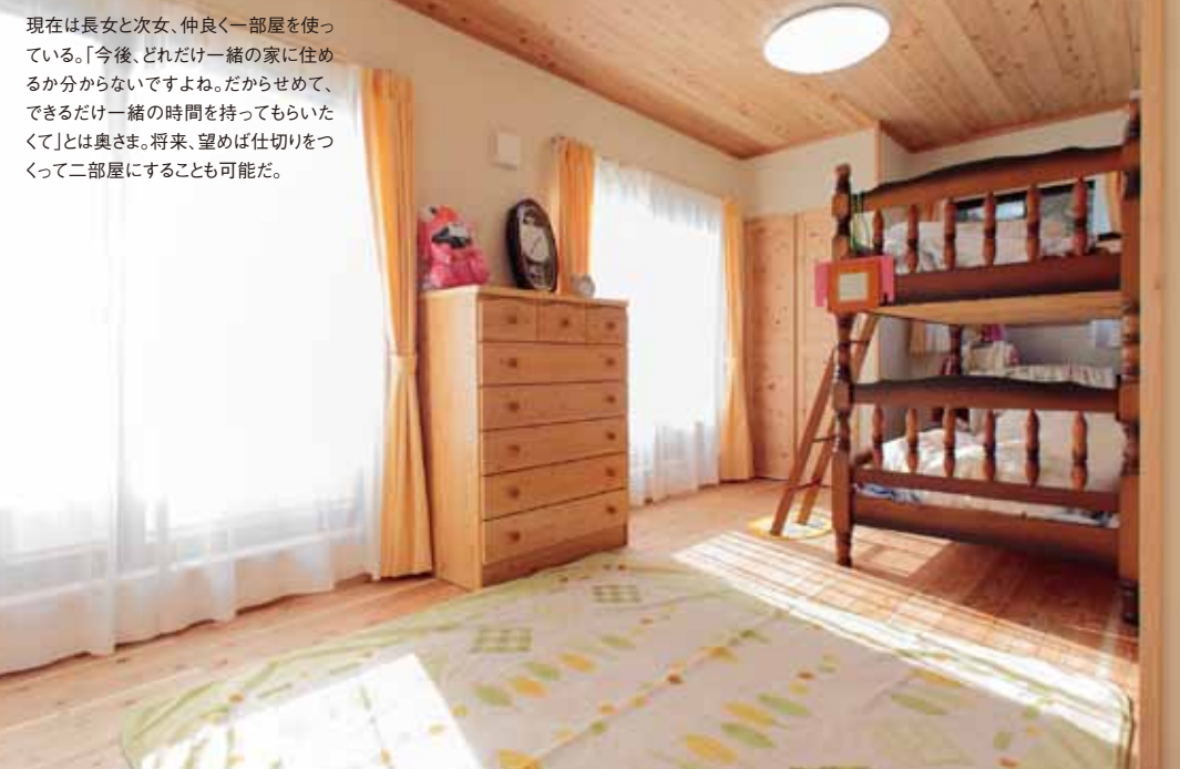
現在は長女と次女、仲良く一部屋を使っている。「今後、どれだけ一緒に家に住めるか分からないですね。だからせめて、できるだけ一緒に時間を持ってもらいたくて」とは奥さま。将来、望めば仕切りをつけて二部屋にすることも可能だ。